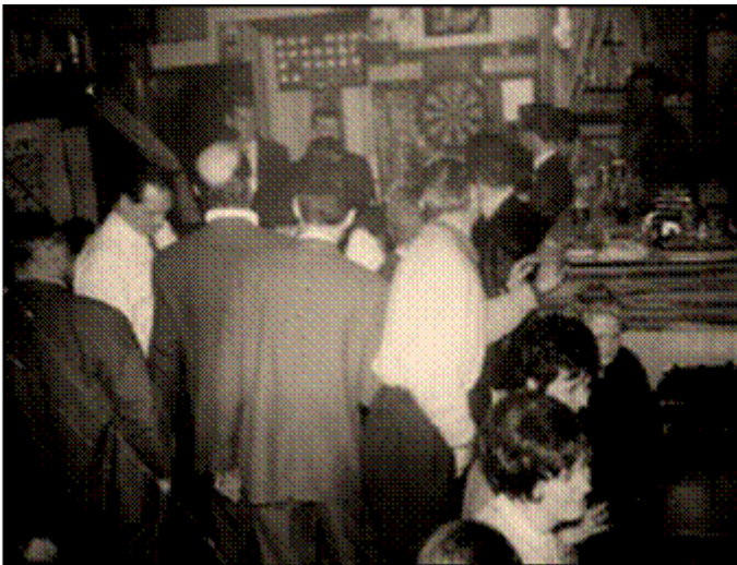
1969 : een zaterdagavond in café Docksy.

Het café telt onder zijn klanten de eerste groep allochtonen uit Noord Afrika in Oostende. Een vijftiental Algerijnse gasten die met de Fransen hebben meegevochten in de Algerijnse burgeroorlog en met hen meekomen. Deze groep is vanuit Duinkerken in Oostende terechtgekomen en velen van hen huwen met een Vlaams meisje. “Een beetje poep en niet betaal” is een gekende spreuk bij hen.